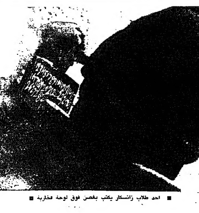
احد طلاب زانسكر يكتب بعض فوق لوحة فخارية

تحسن صحة الرئيس البرازيلي اكذ اطباء في ساو باولو ان حالة الرئيس البرازيلي المنتخب تانكرديو نيفيس الصحية تتحسن بشكل ملموس بعد سلسلة من العمليات الجراحية وأنه يتناول طعاما جامدا. وقال الاطباء امس الاول ان درجة حرارة الرئيس الذي يبلغ من العمر ٧٥ عاما اصبحت طبيعية بعد ان اصعبته بعض الحمى في وقت مبكر من النهار ولم ينتشر موت في موضع اجريت فيه ثلاث جراحات في البطن، على عسكري عام ١٩٦٤، ساو باولو - ر